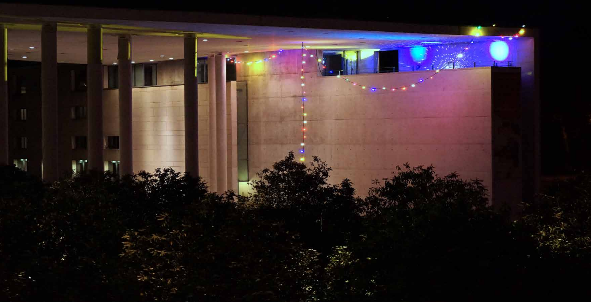
Silent Disco, 2021 Kunstmuseum Bonn // Scheinwerfer, Movingheads, Spiegelkugeln, Lichterkette, Lichtsteuerung / Headlights, movingheads, mirror balls, fairy lights, light control