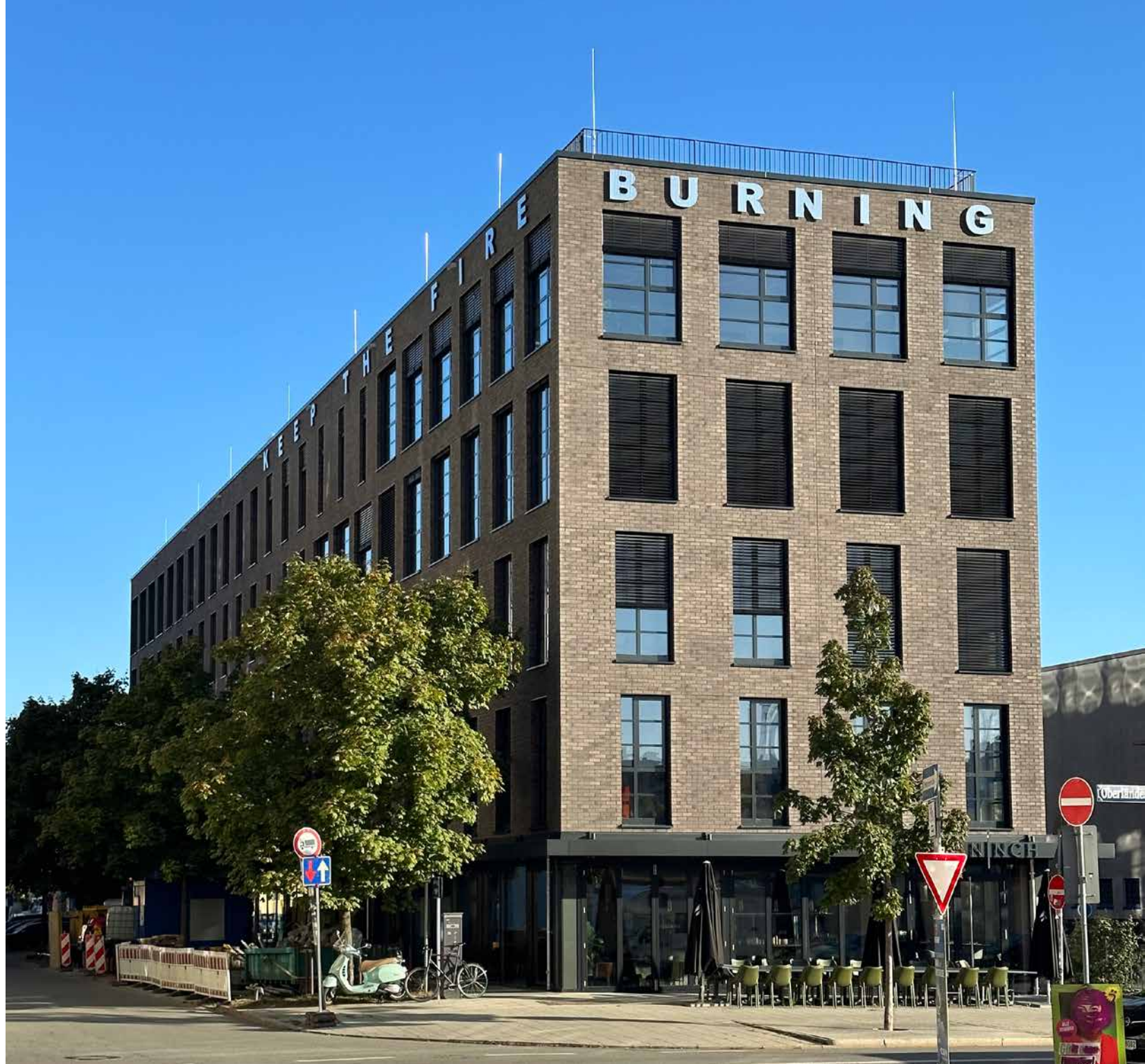
Schütze die Flamme / KEEP THE FIRE, 2022 ComN, München // polierter Edelstahl / Polished stainless steel_ 3200 x 60 cm und 960 x 60 cm