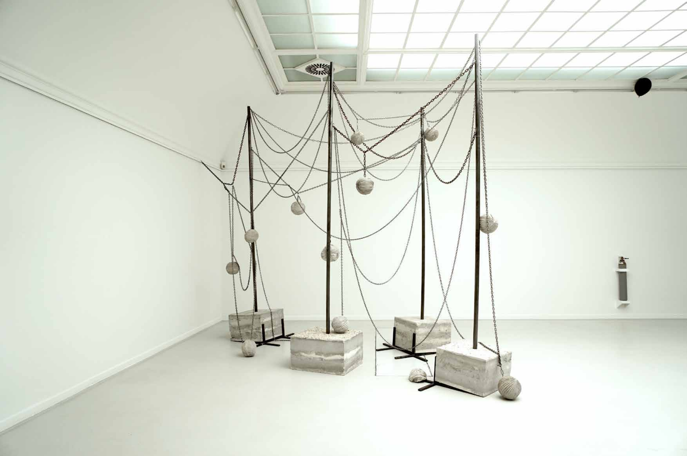
Redentore, 2018 Kunstverein Konstanz // Beton, Eisenketten, Stahl / Concrete, iron chains, steel_500 x 700 x 280 cm