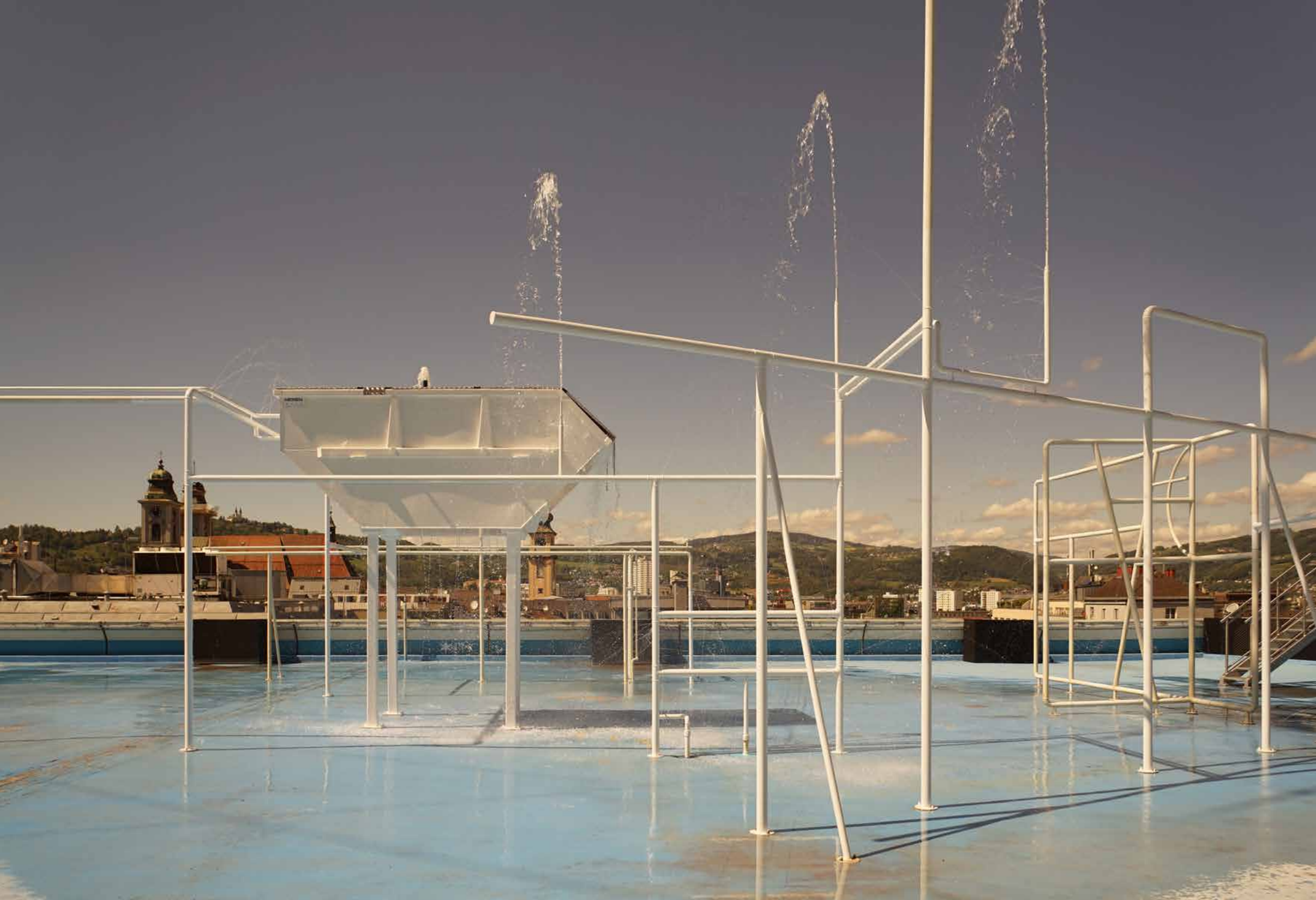
Fontana il Due, 2019 Oberösterreichisches Kulturquartier // Parkdeck, Farbe, Stahl, Wasser, Brunnenpumpen, Steuertechnik / Parking deck, paint, steel, water, well pumps, dmx pump control _850 x 1900 x 1900 cm