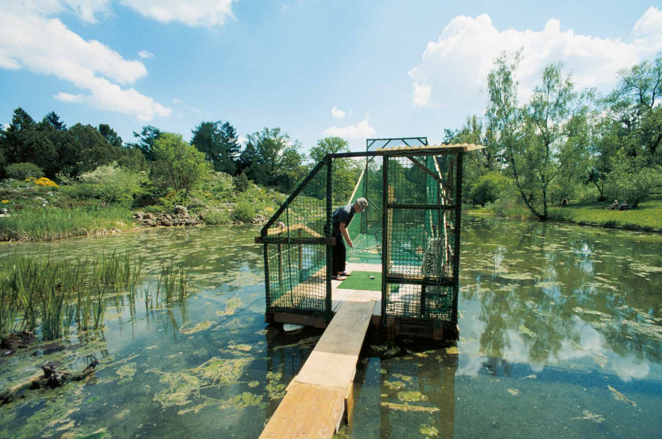
Driving Range, 2001

Wood, nets, surfboards, golf equipment, gramophone_400 x 300 x 900 cm