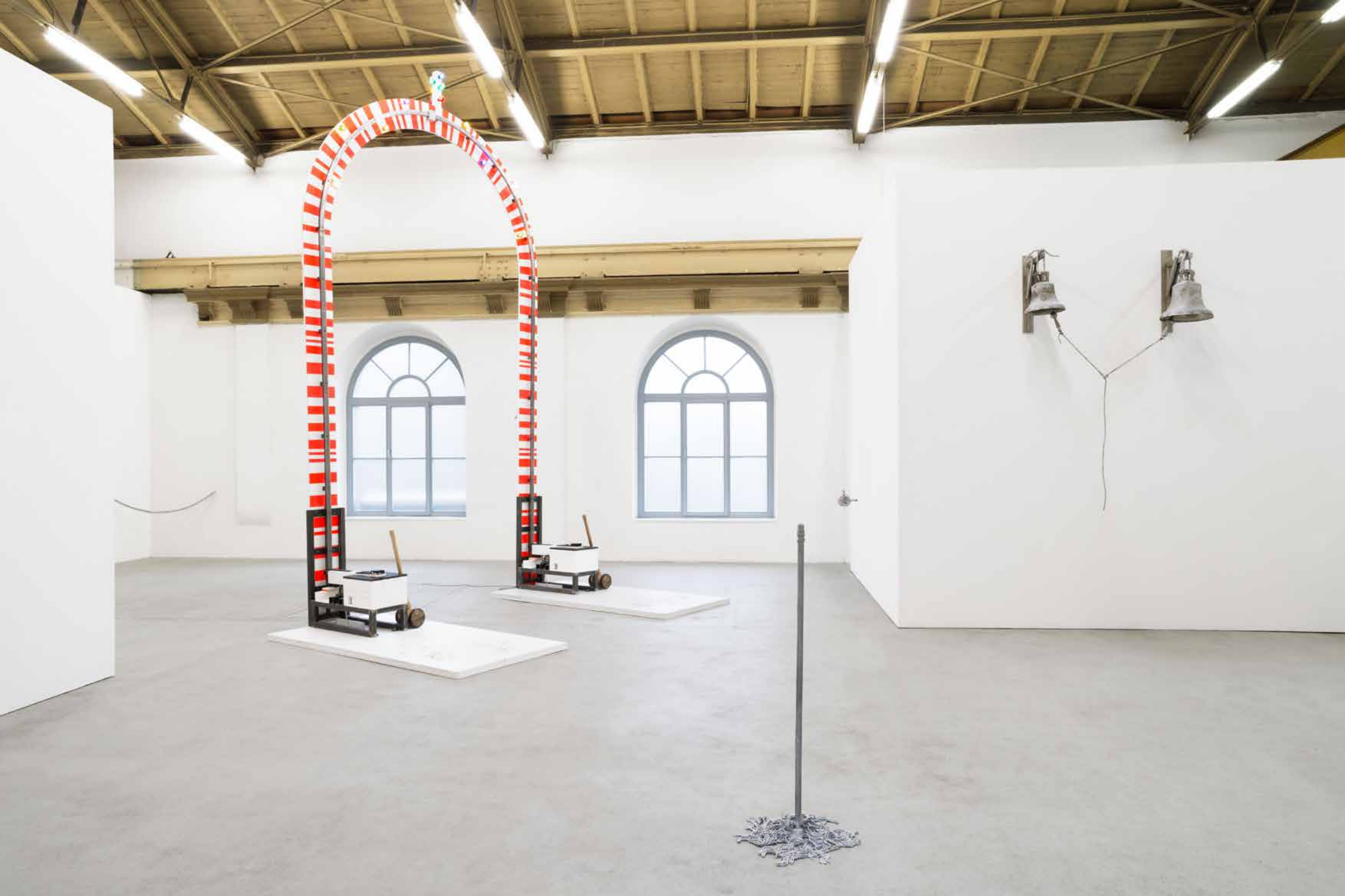
links oben unten rechts / left up down right, 2014 Galerie Jochen Hempel, Leipzig Wood, steel, wooden hammers Wischmop / Wet-Mop, 2014 Aluminum