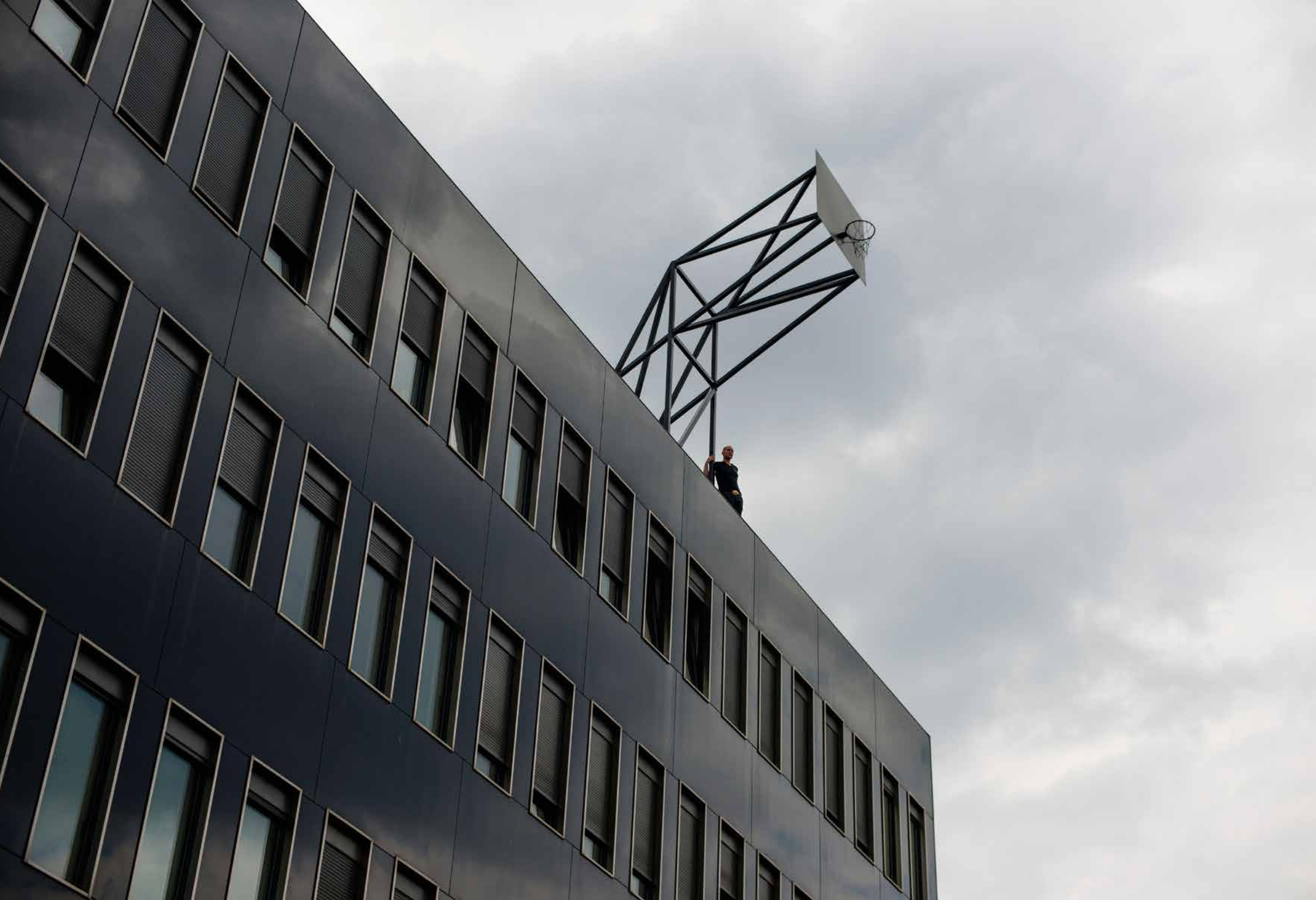
Never Ever, 2012 Leibnitz Rechenzentrum, Technische Universität, München // Basketballkorb, Stahl, Farbe / Basketball basket, steel, colour_650 x 480 x 180 cm