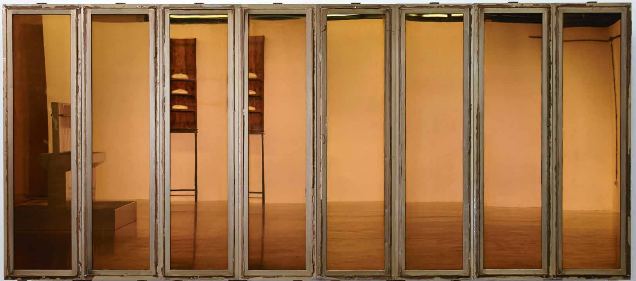
Der Traum von einer großen Sache / The Dream of Something Big, 2008

Städtische Galerie im Lenbachhaus, München // Fassadenscheiben vom ehemaligen Palast der Republik Berlin: Aluminium, Glas, Stahl / Front panels of the former Palace of the Republic Berlin: Aluminum, glass, steel_280 x 40 x 530 cm