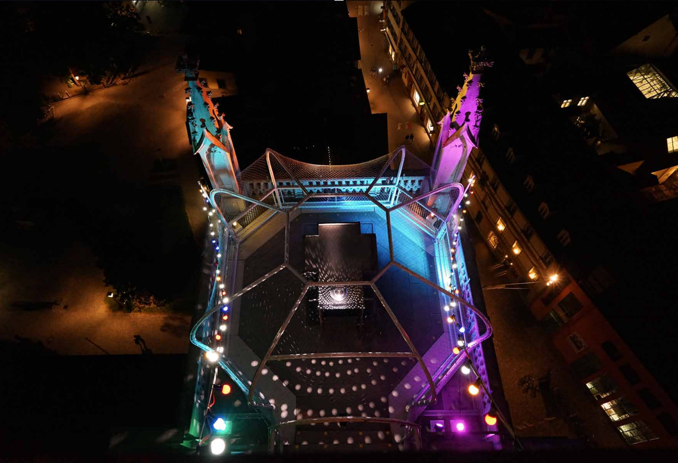
festlich / festive 2018 Münster Konstanz // Lichterketten, LED-Scheinwerfer, Lichtsteuerung / light strings, led par lights, dmx lighting control_1000 x 750 x 800 cm